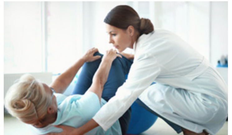
Die Pflegebranche ist die größte Gewinnerin auf dem Arbeitsmarkt

Was die Studie aber nachweist ist ein fortdauernder Strukturwandel der Berufslandschaft. Dieser ist schon länger in vollem Gange und wird durch die Digitalisierung weiter vorangetrieben. So konnten IT-Berufe zwischen 1999 und 2016 ihren Anteil an der Beschäftigung von 2,02 Prozent auf 3,61 Prozent deutlich ausbauen. Auch Maschinenbautechniker oder Unternehmensberater zählen zu den Gewinnern.