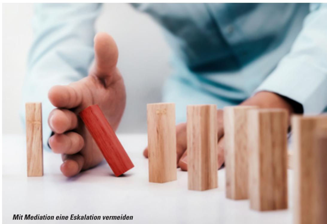
Mit Mediation eine Eskalation vermeiden

Als Königsweg der außergerichtlichen Streitbeilegung gilt die Mediation. Das Mediationsverfahren wird mittlerweile vielfältig genutzt: bei Konflikten zwischen Unternehmen, aber auch bei Streit innerhalb einer Firma, etwa in der Geschäftsführung, in Teams oder