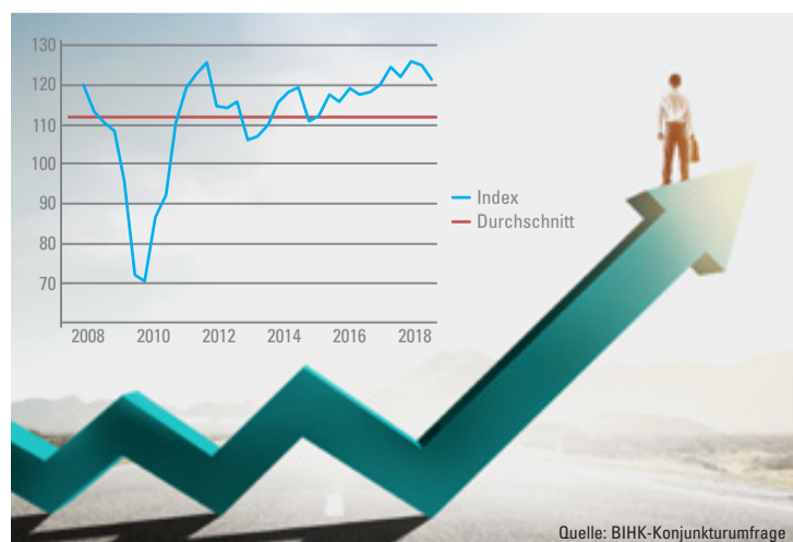
Weiter auf Erfolgskurs – der BIHK-Konjunkturindex sank zuletzt nur leicht