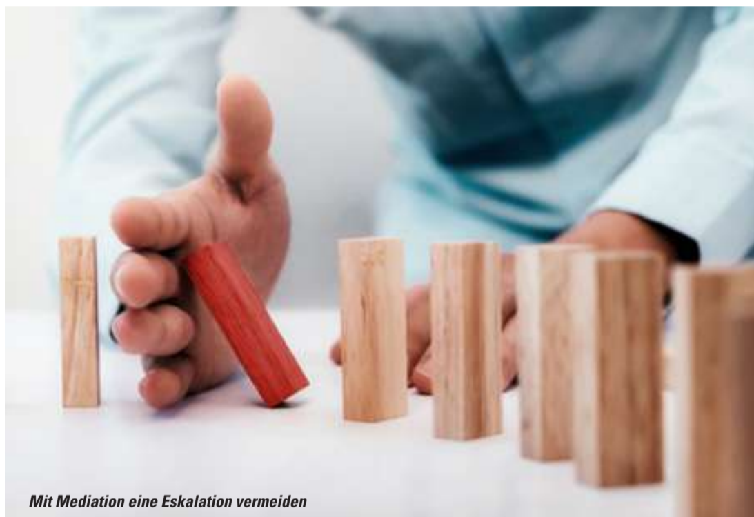
Mit Mediation eine Eskalation vermeiden

Als Königsweg der außergerichtlichen Streitbeilegung gilt die Mediation. Das Mediationsverfahren wird mittlerweile vielfältig genutzt: bei Konflikten zwischen Unternehmen, aber auch bei Streit innerhalb einer Firma, etwa in der Geschäftsführung, in Teams oder