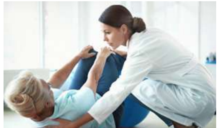
Die Pflegebranche ist die größte Gewinnerin auf dem Arbeitsmarkt

Was die Studie aber nachweist ist ein fortdauernder Strukturwandel der Berufslandschaft. Dieser ist schon länger in vollem Gange und wird durch die Digitalisierung weiter vorangetrieben. So konnten IT-Berufe zwischen 1999 und 2016 ihren Anteil an der Beschäftigung von 2,02 Prozent auf 3,61 Prozent deutlich ausbauen. Auch Maschinenbautechniker oder Unternehmensberater zählen zu den Gewinnern.