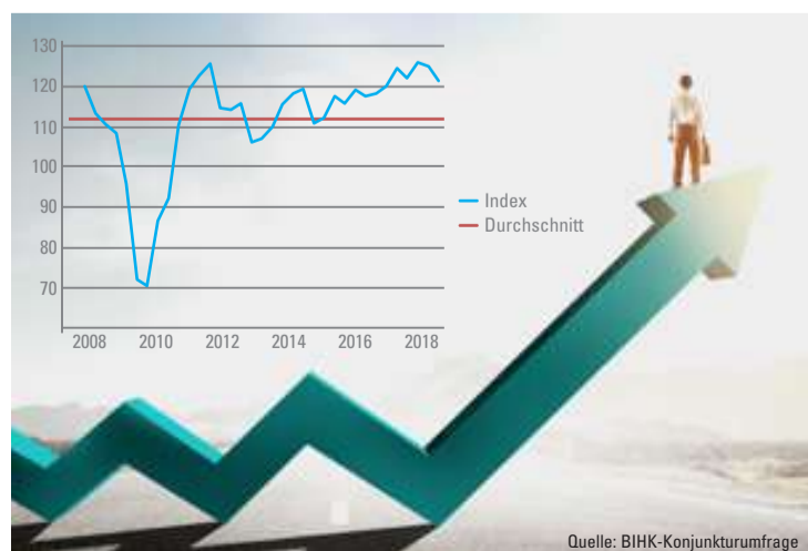
Weiter auf Erfolgskurs – der BIHK-Konjunkturindex sank zuletzt nur leicht